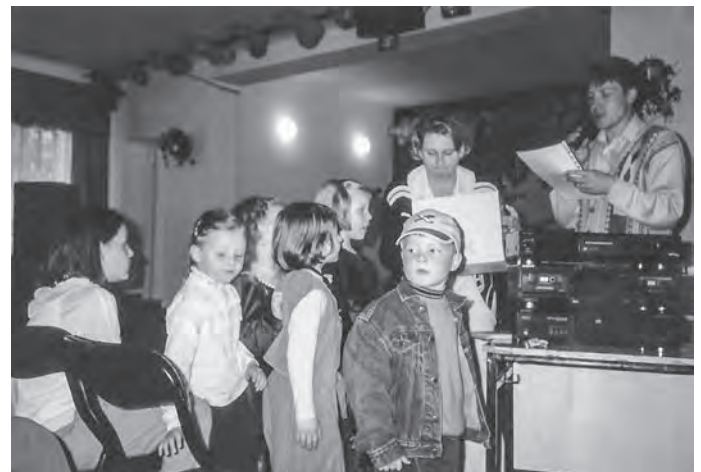
Fot.: Od góry: I Gminny Festiwal Piosenki Dziecięcej zorganizowany w roku 1995 i jego publiczność; uczestniczki VII edycji konkursu oraz przebieg X Festiwalu w roku 2004.