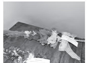
Fot.: Wyróżniona w konkursie palma.