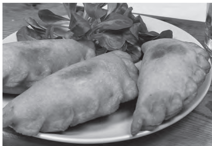
Fot.: Propozycja podania czebureków, dania tatarskiego.