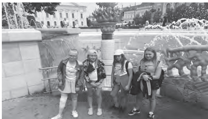
Fot.: Zwiedzanie węgierskiego Debreczyna. Po prawej: Zachwycające wnętrze debreczyńskiej biblioteki.

Program sobotniego wyjazdu do Lublina był bardzo napię-