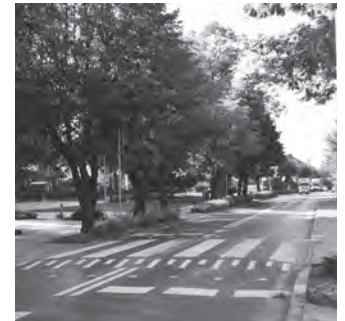
Fot. Przejście dla pieszych w Puchaczowie.

Równocześnie zakończono budowę chodnika o długości ponad 500 metrów przy drodze krajowej nr 82 na trasie Stara Wieś – Brzeziny. Koszt inwestycji pochłonął 322.720,02 zł.