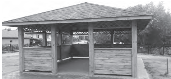
Fot.: Altana w Ostrówku sfinansowana ze środków funduszu.

Sylwia Biedacha Inspektor ds. funduszy sołectkich