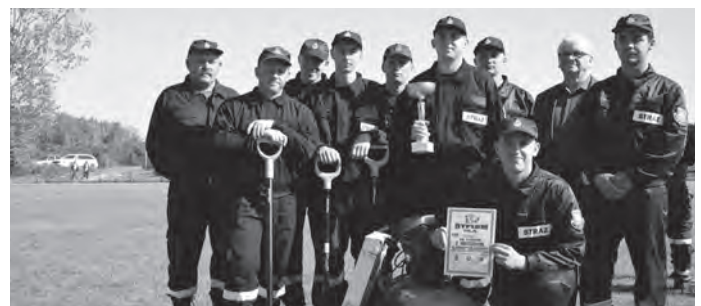
Fot.: Drużyna Ochotniczej Straży Pożarnej z Ostrowka.