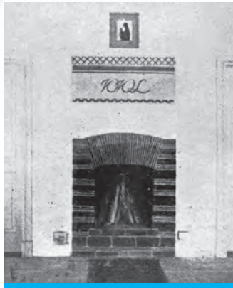
Fot.: Kominek znajdujący się na parterze, naprzeciwko wejścia do posiadłości, z inicjałami właścicieli. Tuż po ukończeniu jego budowy nie było nad nim obrazka, jak podaje Wiktor Lachert, acyfryzmskie, tuż nad górnymi piętami, w miejscu „krzyżykowego” zdobienia.

W hallu, po obu stronach kominka, były duże dwuskrzydłowe drzwi. Z prawej prowadzące do stołowego, z lewej do salonu. Oba pokoje były pokaźnych rozmiarów. Salon trochę większy, miał 50 m 2 . Oddzielały je czteroramienne, od połowy do góry przeszklone, drzwi. Zajmowały one