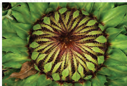
Fot. Rafał Łopucki: Dziewięciświat popłocholistny Carlina onopordifolia [Wirtualne Muzeum Przyrodnicze, dostęp: https://www.kul.pl/gal_11710.html ].